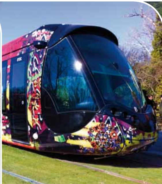
Le tramway ligne 3