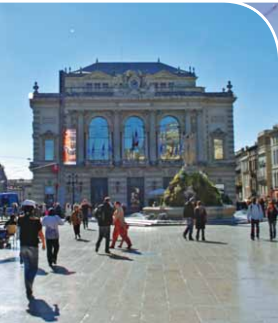
La place de la Comédie

Choisir Juvignac, c'est le choix raisonné de la qualité de vie, dans une ville à taille humaine qui fait le pari de l'avenir.