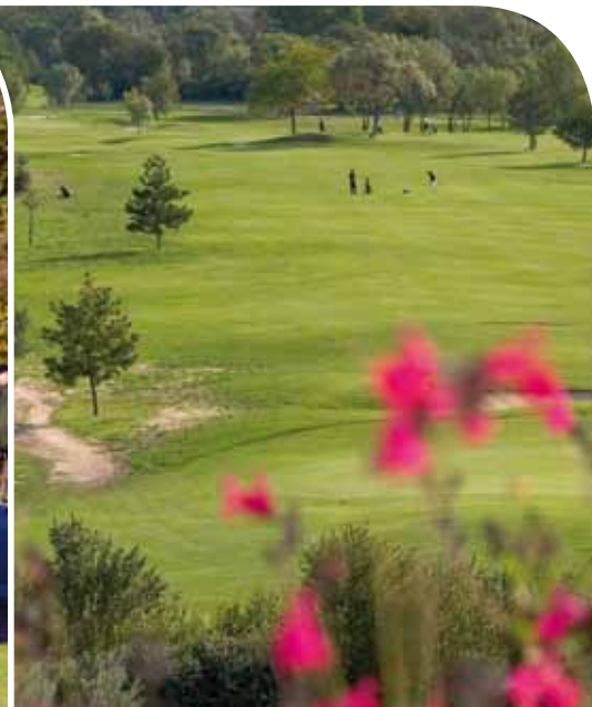
Le golf de Fontcaude